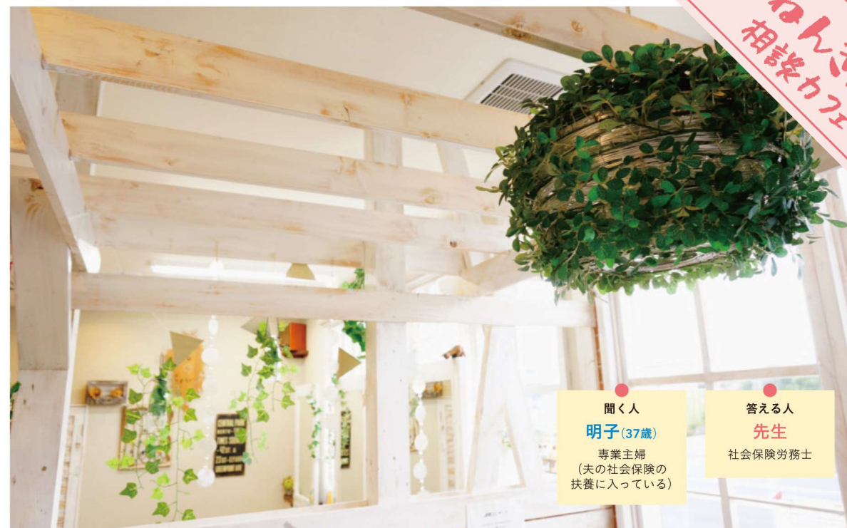
聞く人 明子(37歳) 専業主婦 (夫の社会保険の扶養に入っている) 答える人 先生 社会保険労務士

◆ 2年より古い期間の保険料を納付できる制度 いずれの場合も、納付額は、当時の保険料額に加算がつきます。 ● 2018年3月31日まで実施されている「特例追納」 ※納付時点の年齢によって納付可能期間が異なります。 ● 2018年9月30日まで実施の後納制度(過去5年分のみ) ※老齢基礎年金を受けている方は利用不可。